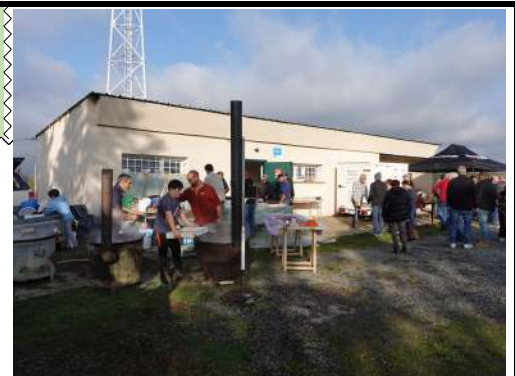
Les membres de l'ACCA en plein travail

L'ACCA a tenu sa traditionnelle matinée boudin le 10 novembre dernier. La manifestation s'est déroulée pour la première fois à la Salle du Stade, toute neuve et fonctionnelle. Et ce fut une réussite : quelque 300 mètres de boudin et plus de mille caillettes ont été vendus, le tout dans la joie et la bonne humeur, à la faveur d'une météo particulièrement clémente.