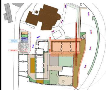
Cheminement provisoire pendant la première phase de travaux