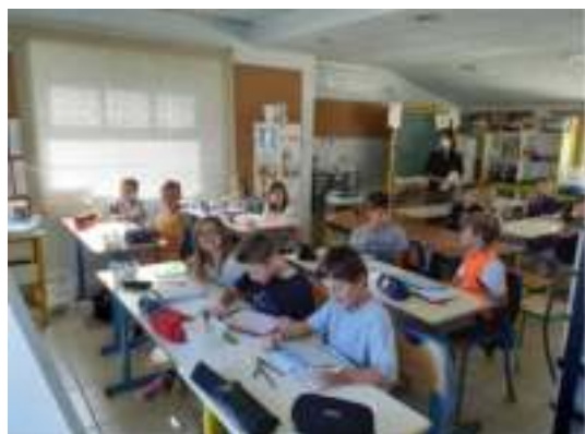
La classe de CE1, CM1 & CM2